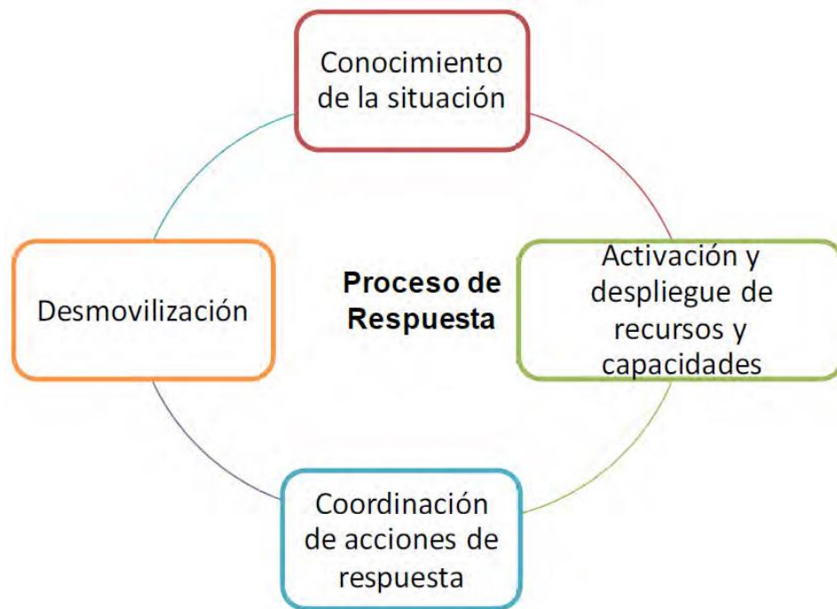
Figura 2: Proceso de respuesta

Las acciones clave que se presentan en la fase de respuesta son: