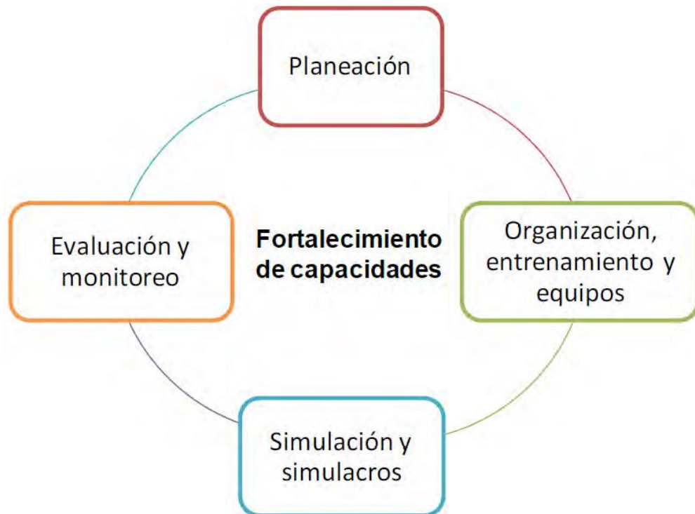
Figura 1: Proceso de Fortalecimiento de capacidades.

La fase preparación involucra las actividades que se realizan antes de ocurrir la emergencia con el fin de tener mejores capacidades y mejorar la respuesta efectiva en caso de un desastre, y sus principales aspectos son: