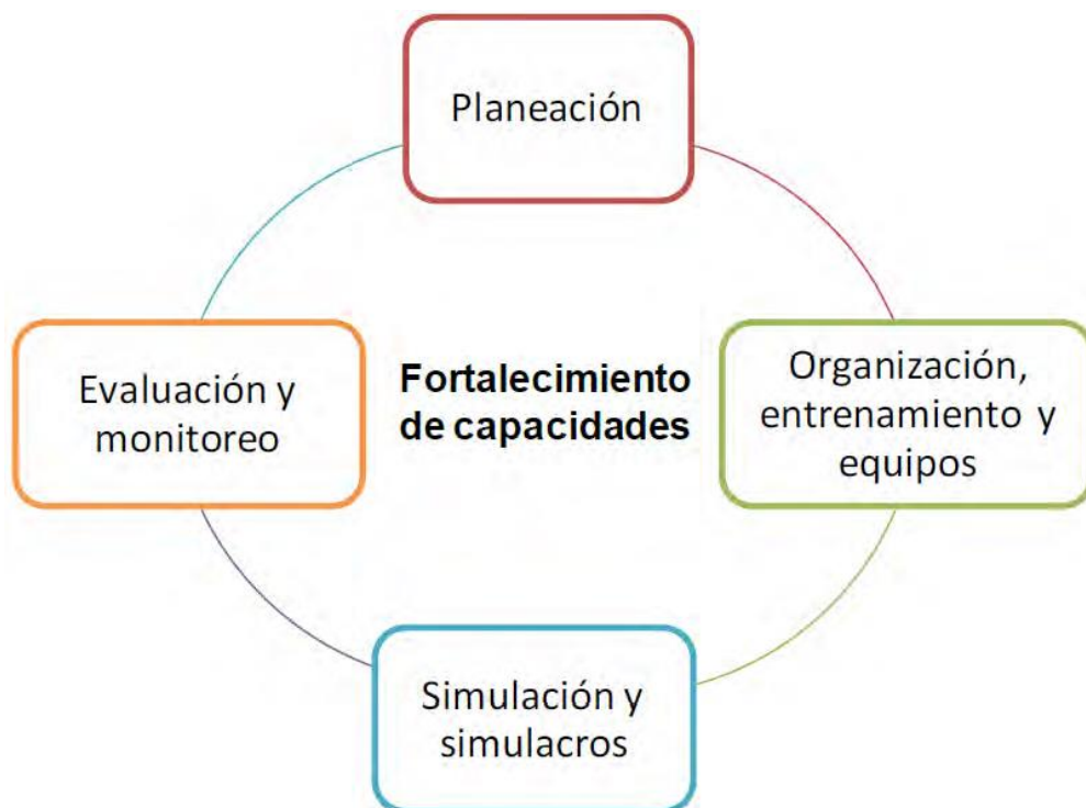
Figura 1: Proceso de Fortalecimiento de capacidades.

La fase preparación involucra las actividades que se realizan antes de ocurrir la emergencia con el fin de tener mejores capacidades y mejorar la respuesta efectiva en caso de un desastre, y sus principales aspectos son: