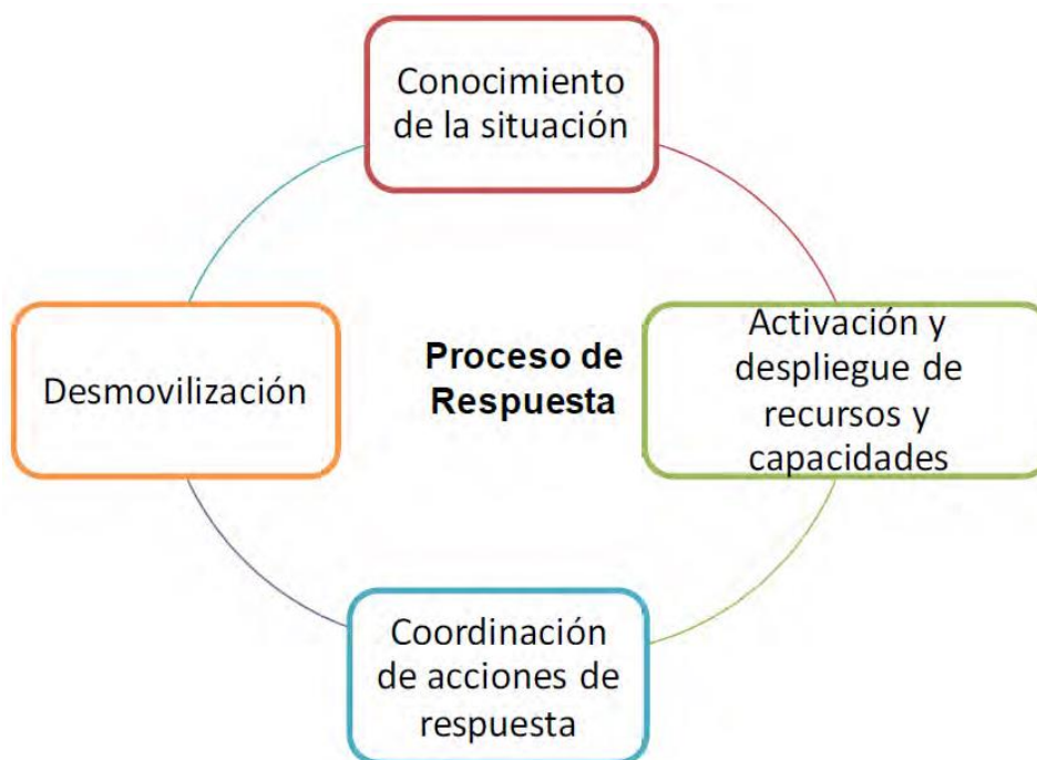
Figura 2: Proceso de respuesta

Las acciones clave que se presentan en la fase de respuesta son: