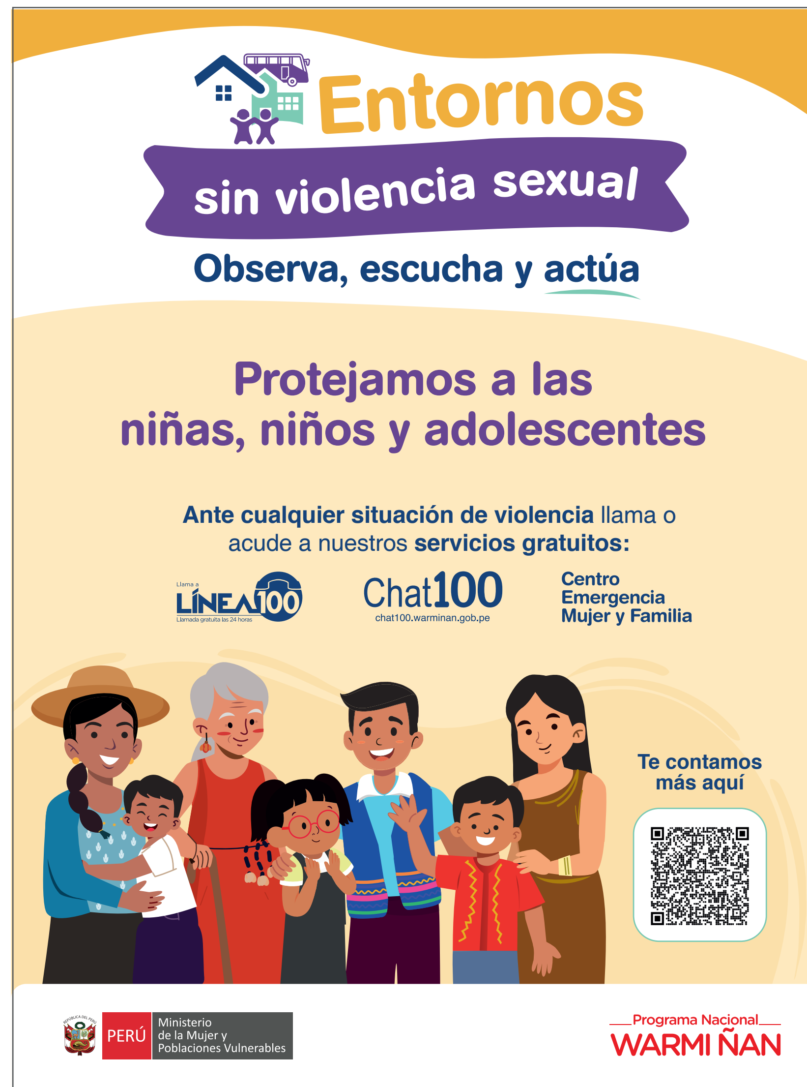
Afiche 80x60 cm